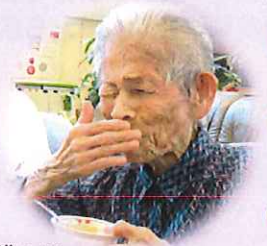
おはぎの美味しかったよ～♡