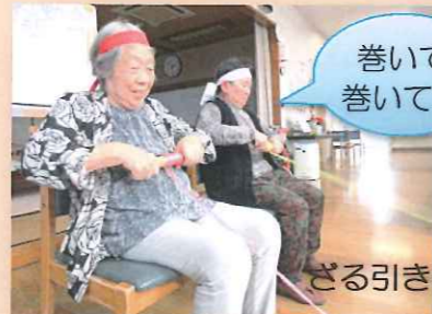
巻いて巻いて! ざる引き