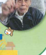
『かかし』 か『人』か わからんね